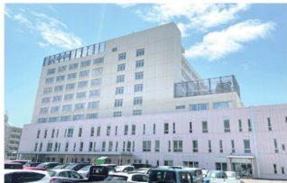
中通総合病院 徒歩6～7分