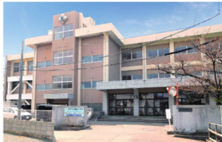
秋田市立築山小学校 徒歩8～9分