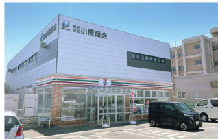
セブン-イレブン秋田南通宮田店 徒歩4～5分