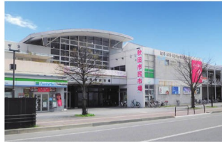
秋田市民市場 徒歩10～11分