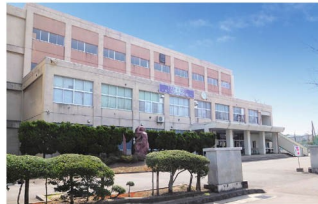
秋田市立秋田南中学校 徒歩4～5分