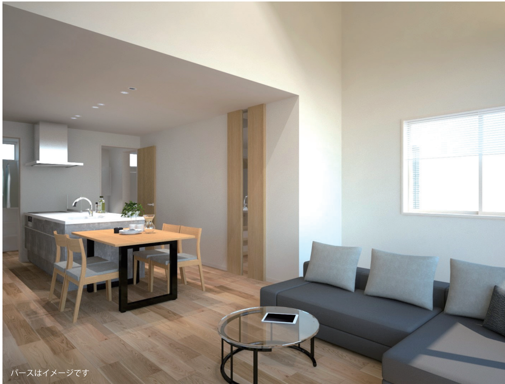
パースはイメージです