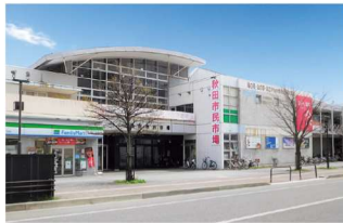
秋田市民市場 徒歩10～11分