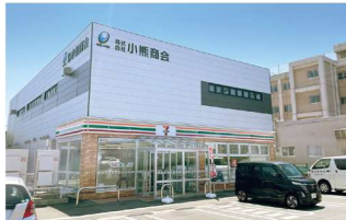
セブン-イレブン秋田南通宮田店 徒歩4～5分