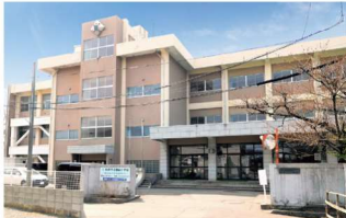
秋田市立築山小学校 徒歩8～9分