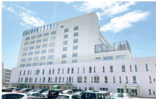
中通総合病院 徒歩6～7分