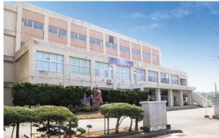
秋田市立秋田南中学校 徒歩4～5分