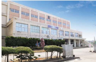
秋田市立秋田南中学校 徒歩4～5分