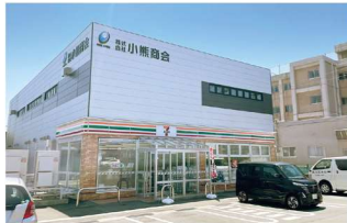
セブン-イレブン秋田南通宮田店 徒歩4～5分