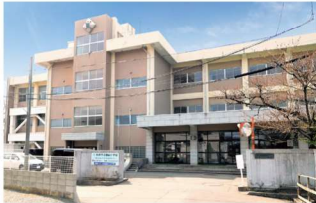
秋田市立築山小学校 徒歩8～9分