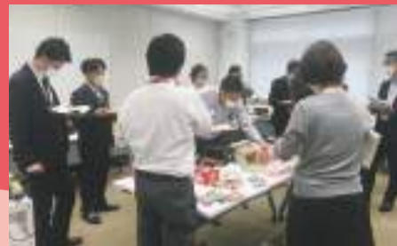
セレクト商品選定会の様子