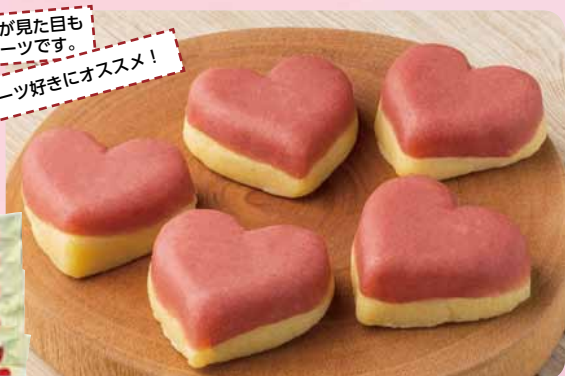
スイーツ好きにオススメ!