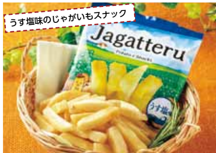
うす塩味のじゃがいもスナック